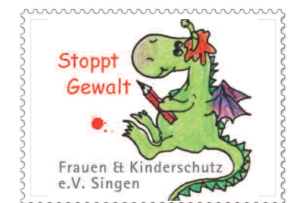
Unsere "eigene Briefmarke"