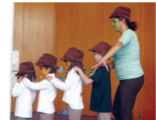
Theaterprojekt „Peter und der Wolf“